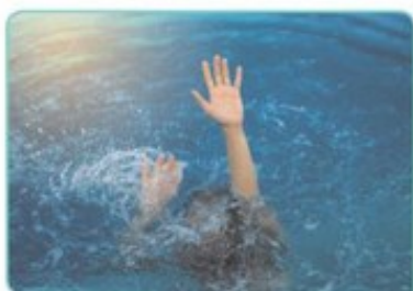
de levensbedreigende situatie